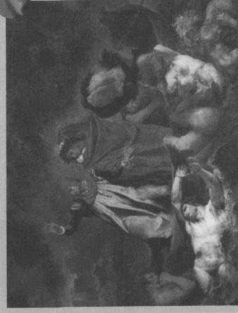
Eugène Delacroix: Dante a Vergilius