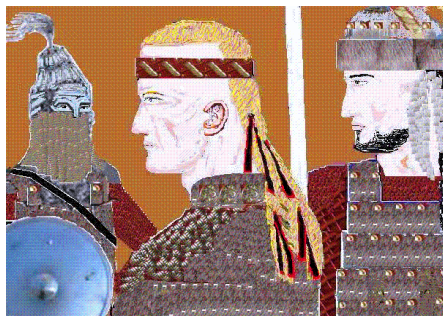
Avarští válečníci. [cit. 2009-27-01]. Na

Čtyřicátého roku kralování Clothara (623/624) muž jménem Sám, národem Frank z kraje saskonského, vzal s sebou četné kupce a odebral se mezi Slované jménem Venédy, aby obchodoval. Slované již počali bojovati proti Avarům, jménem Hunům, a jejich králi – chaganovi. Venédové byli již odedávna bojovníky Hunů, tak když Hunové útočili vojskem proti kterémukoli kmeni, Hunové stavěli své sjednocené vojsko k ochraně táborů, Venédové pak bojovali; jestliže nabyli vrchu k vítězství, tehdy Hunové udeřili, aby brali kořist; pakli však byli Venédové přemáháni, podporováni pomocí Hunů, opět nabývali sil. Proto byli zvaní od Hunů bojovníky, že v bojovém