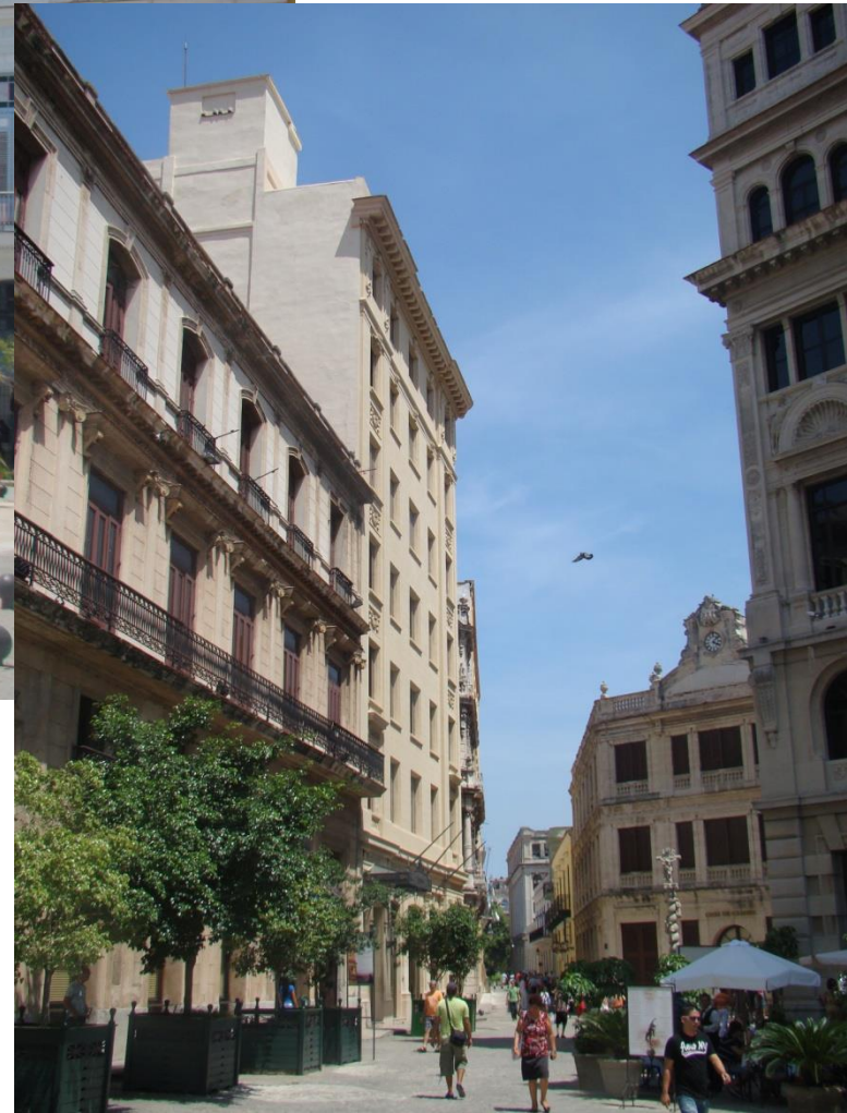
Havana Vieja – stará Havana