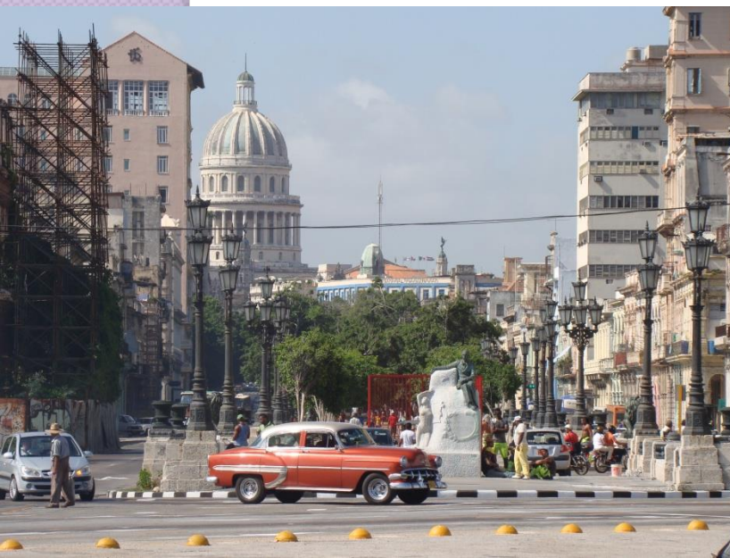
Ulice Prado, Havana