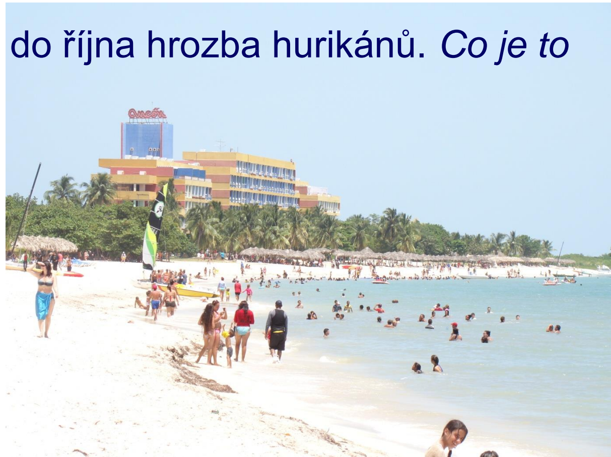
Pláž Ancón, jižní pobřeží Kuby