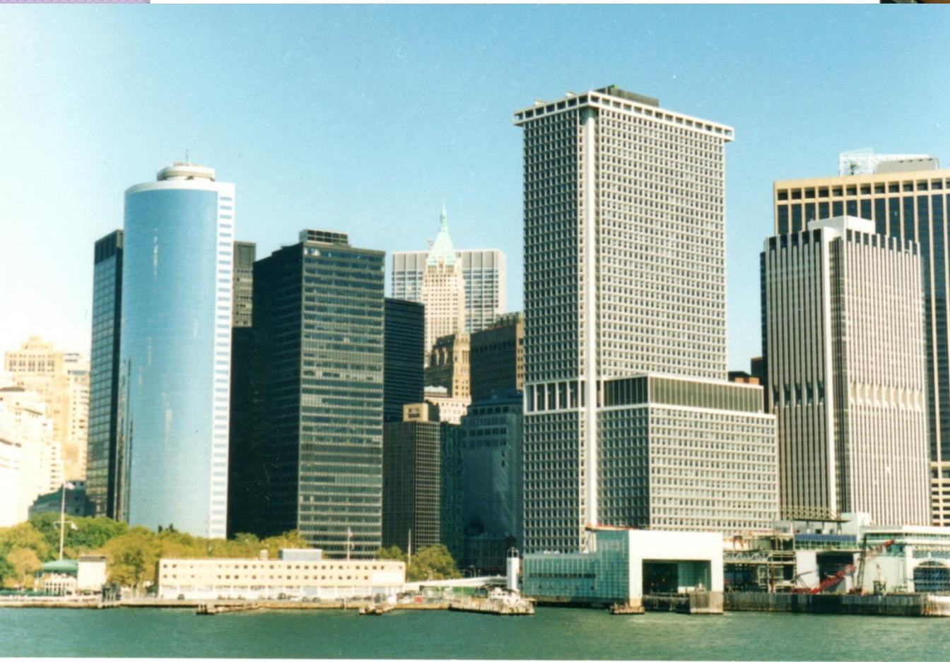
New York - Manhattan