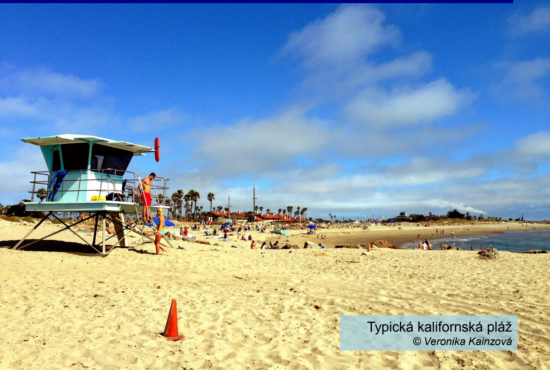
Typická kalifornská pláž