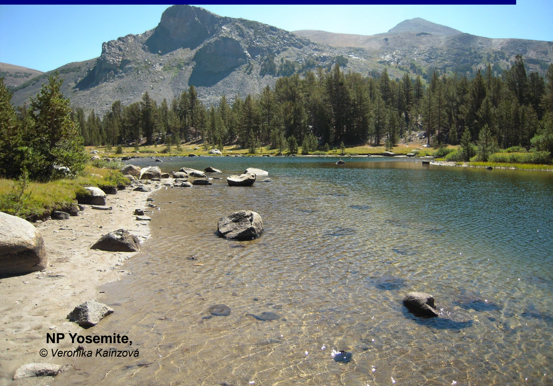
NP Yosemite