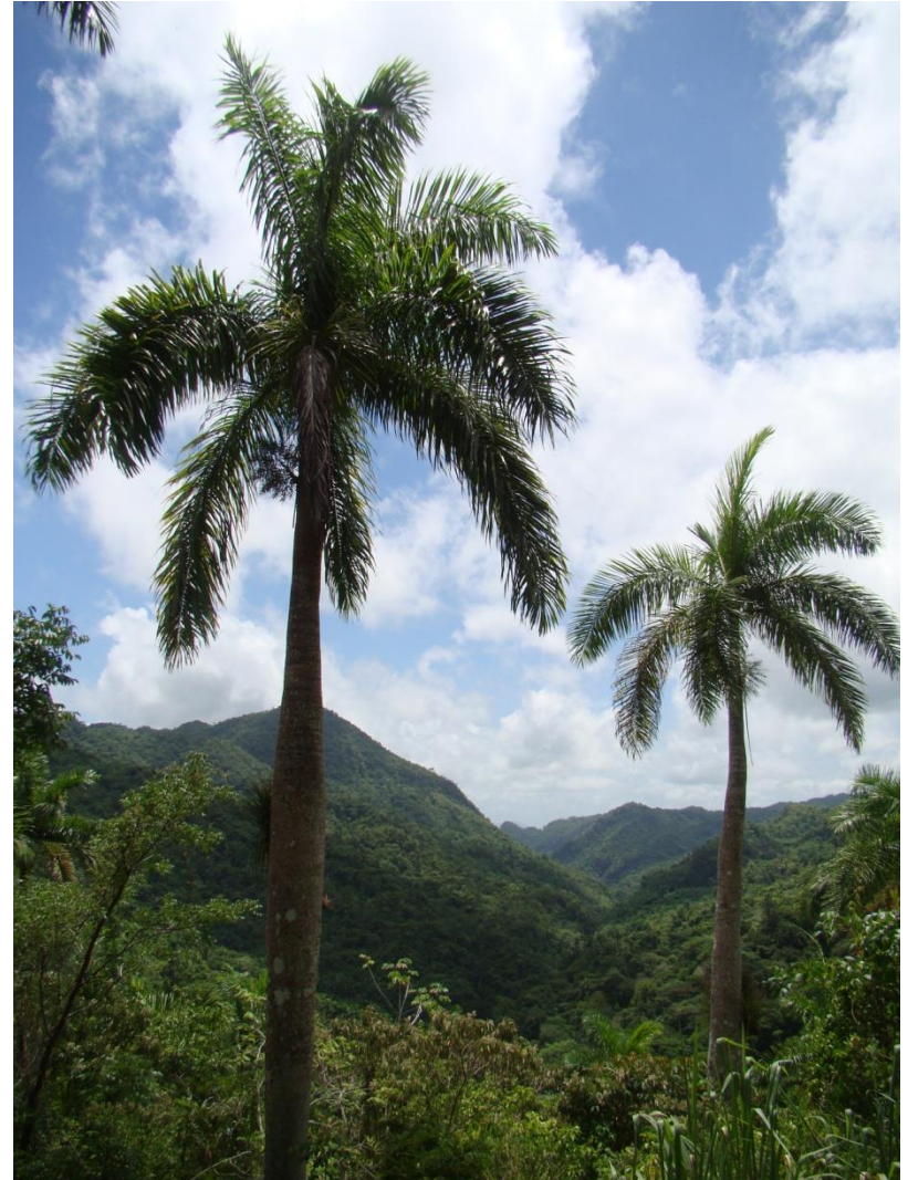
Tropická vegetace na Kubě svědčí o dostatku srážek

S pomocí atlasu zjistěte, který podnebný pás pokrývá největší území Ameriky.