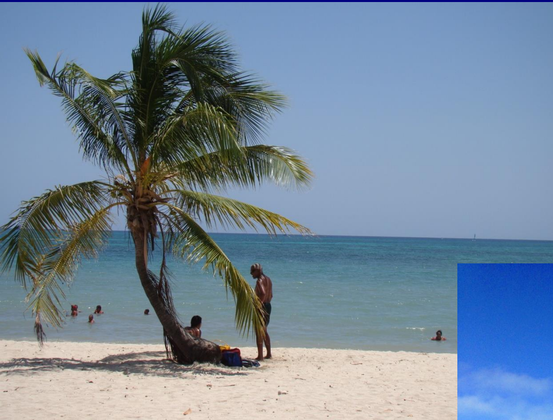
Pobřeží Karibského moře, Kuba