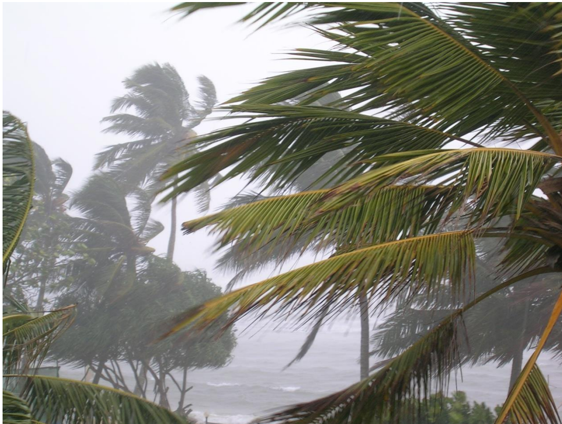
Prudký monzunový liják

Jaké možnosti z toho plynou pro cestovní ruch?