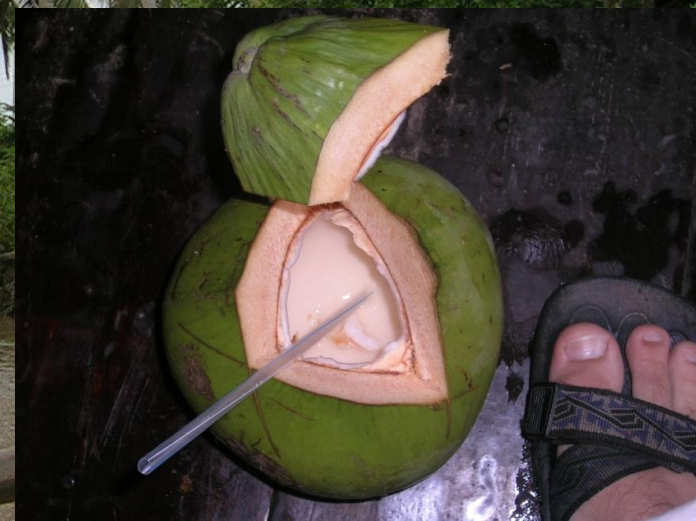
Palma kokosová, kokosový ořech, jižní Vietnam