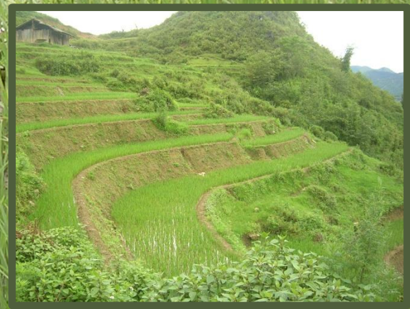
Rýžová políčka, Vietnam