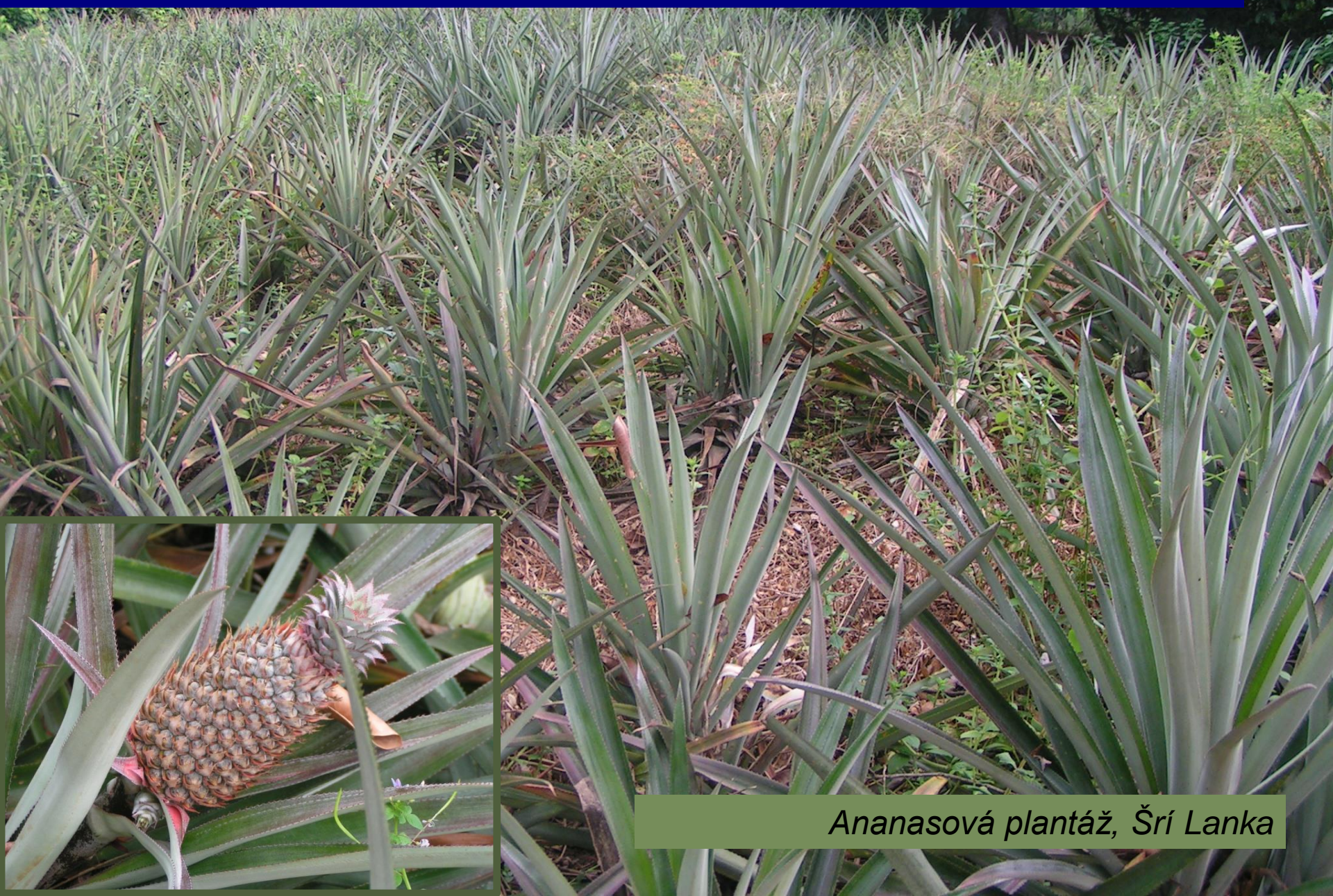
Ananasová plantáž, Šrí Lanka