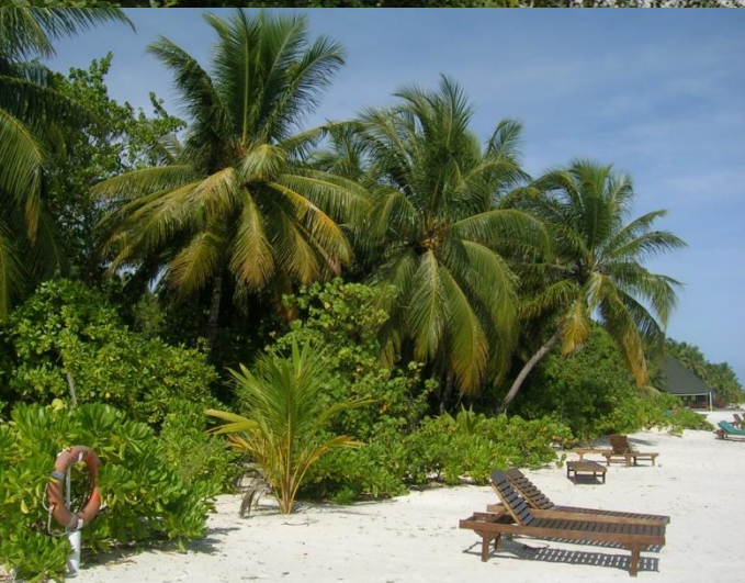
Palma kokosová, Maledivy