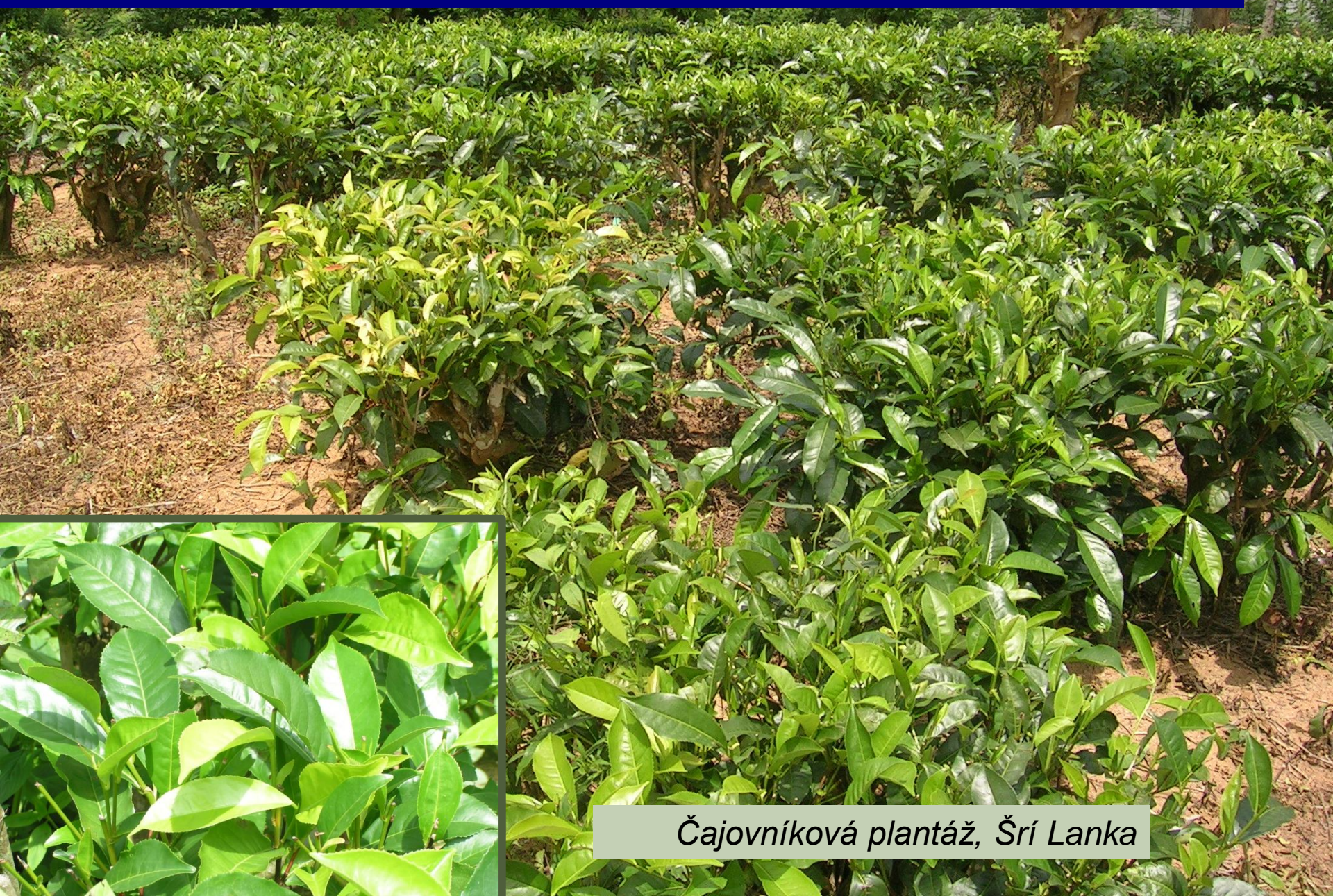
Čajovníková plantáž, Šrí Lanka