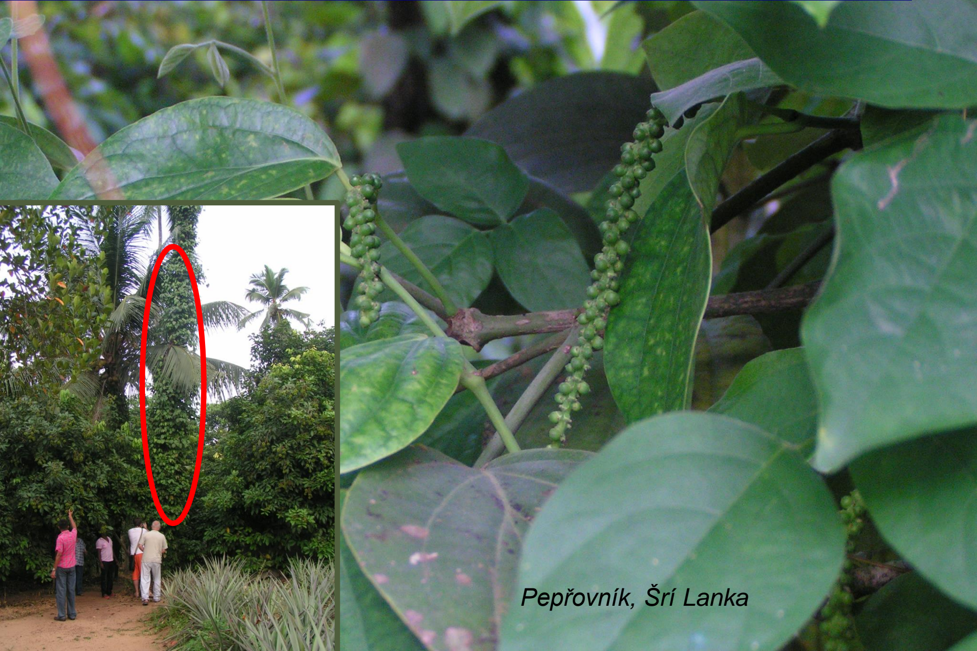
Pepřovník, Šrí Lanka