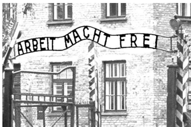
obr. č. 3 Brána do koncentračního tábora Osvětim – Práce osvobozuje

Autorem materiálu a všech jeho částí, není-li uvedeno jinak, je Mgr. Eva Mužná. Dostupné z Metodického portálu www.rvp.cz , ISSN: 1802-4785. Provozuje Národní ústav pro vzdělávání, školské poradenské zařízení a zařízení pro další vzdělávání pedagogických pracovníků (NÚV).