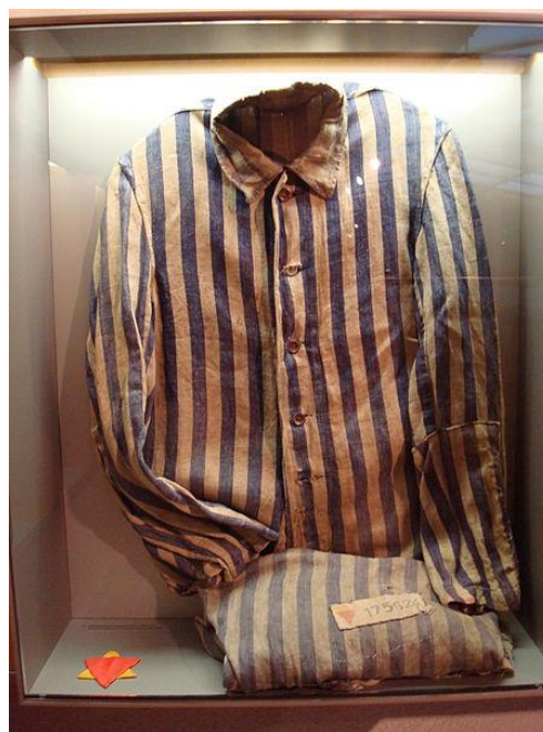
obr. č. 2 Vězeňský stejnokroj