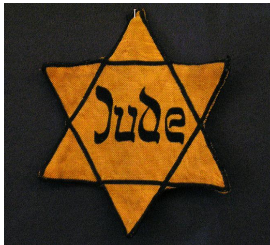
obr. č. 5 Židovská Davidova hvězda