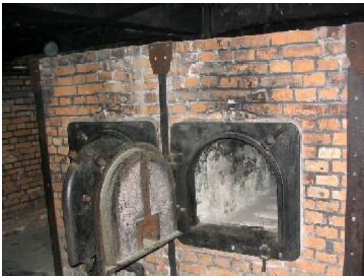
obr. č. 4 Spalovací pec