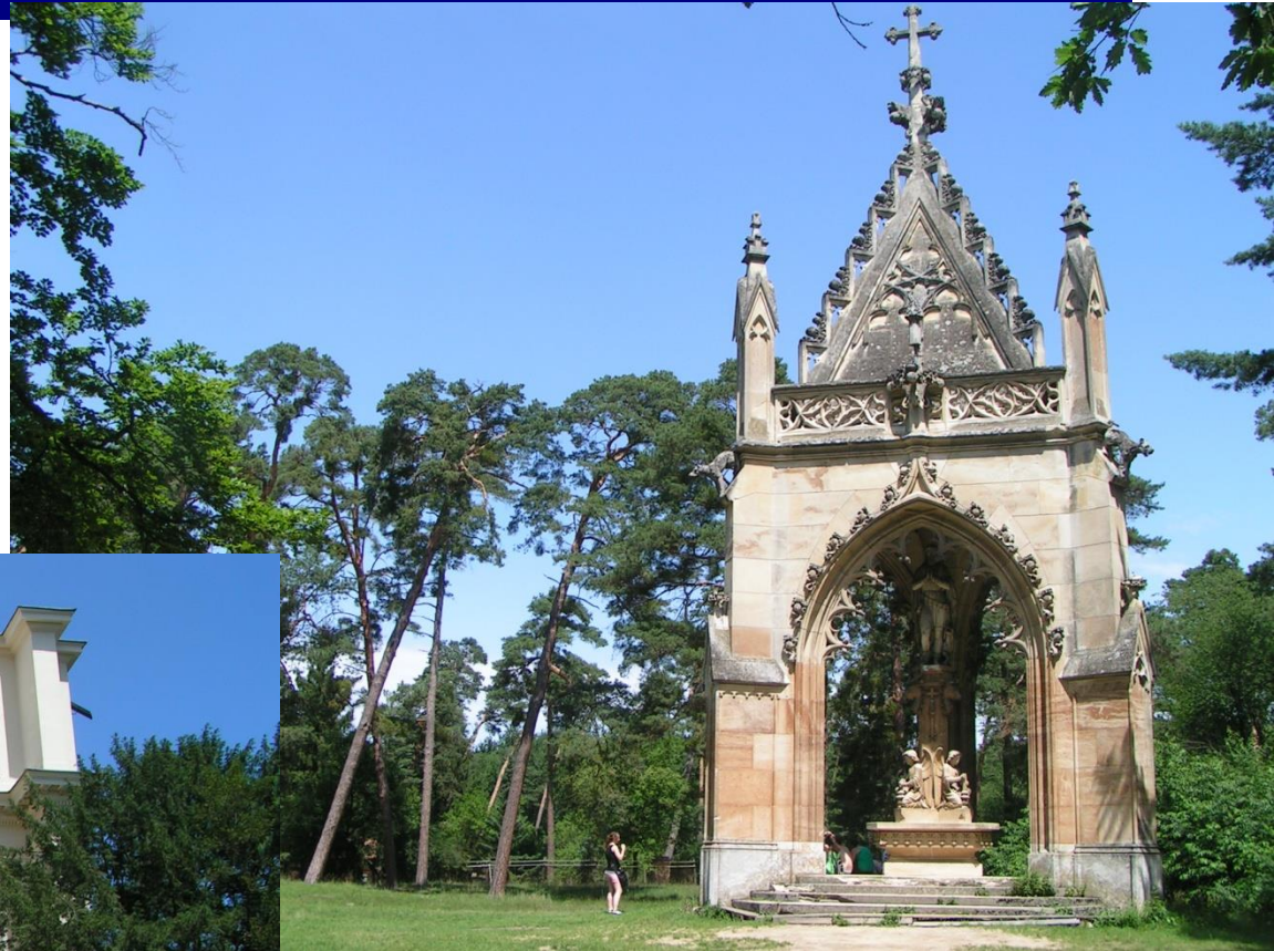
kaple sv. Huberta