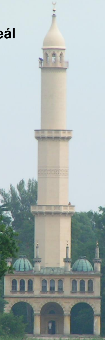
Lednicko-valtický areál minaret