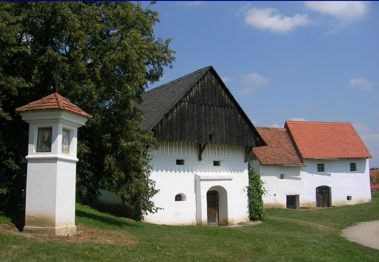
Muzeum vesnice jihovýchodní Moravy, Strážnice