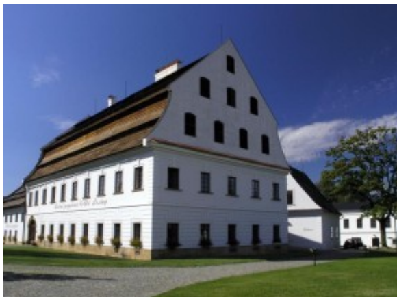
Obr. 1 Ruční papírna ve Velkých Losinách